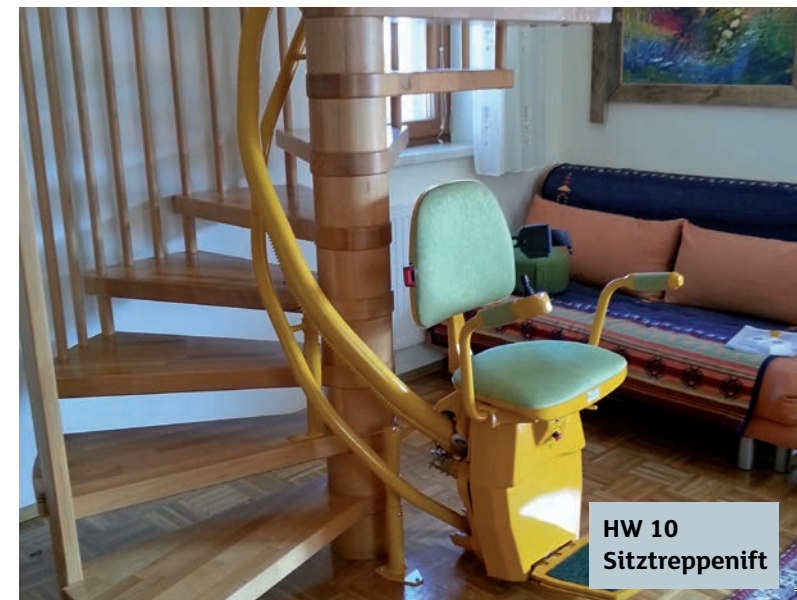
HW 10 Sitztreppenlift