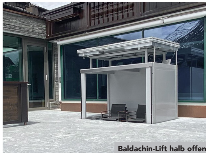
Baldachin-Lift halb offen